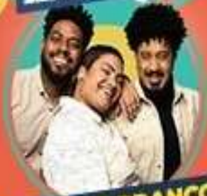
PRETO NO BRANCO 12/05 - SEXTA