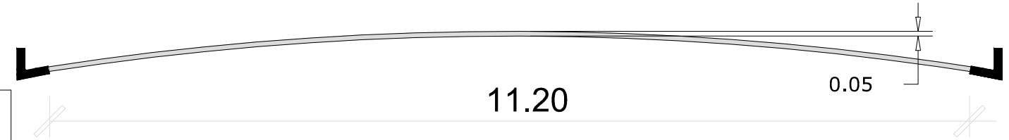
DETALHE DO RECAPEAMENTO ASFÁLTICO ESCALA. 1:100