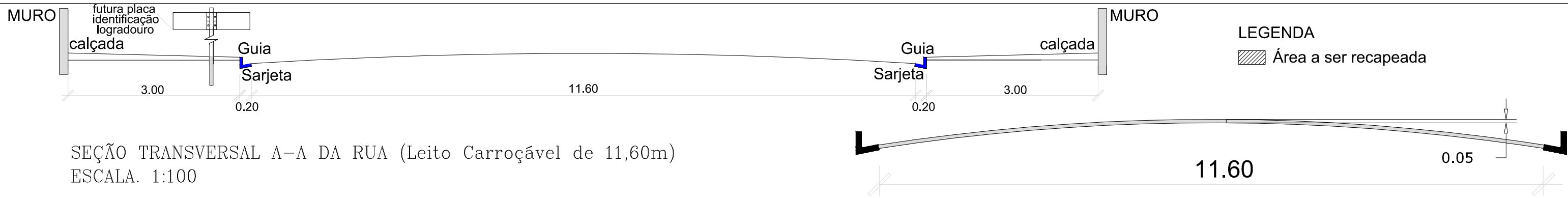
SEÇÃO TRANSVERSAL A-A DA RUA (Leito Carroçável de 11,60m) ESCALA. 1:100