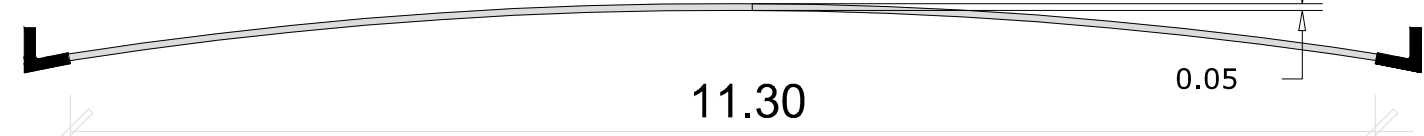
DETALHE DO RECAPEAMENTO ASFÁLTICO ESCALA. 1:100