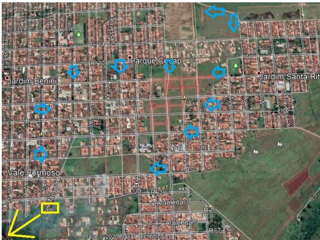
Imagem 02: Sentido das águas.

Abaixo na imagem 02, as SETAS AZUIS, simbolizam de maneira simplificada o ciclo natural do curso da água nesta localidade. A SETA AMARELA, marca o ponto em que o extravasor deságua no córrego mais próximo.