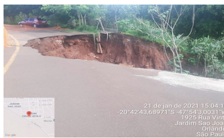
FOTO 2 - RUA 20, PONTO ATINGIDO PELA EROSÃO