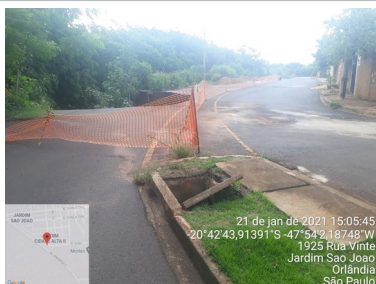
FOTO 1 - RUA 20, PONTO ATINGIDO PELA EROSÃO