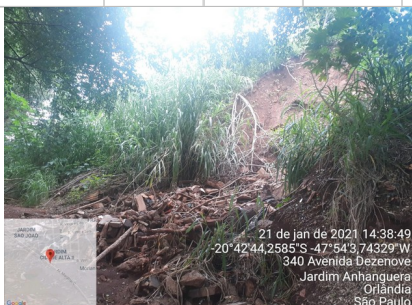
FOTO 5 - MARGINAL FEPASA, VISTA DA EROSÃO