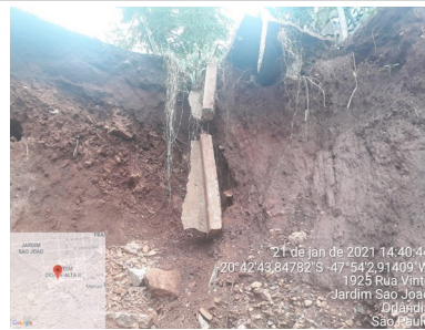
FOTO 6 - MARGINAL FEPASA, VISTA DA EROSÃO