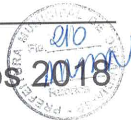
Tabela de Cachês para músicos 2018

TABELA CORRIGIDA PELO IGPM DA FGV ( INDICE DO GOVERNO)