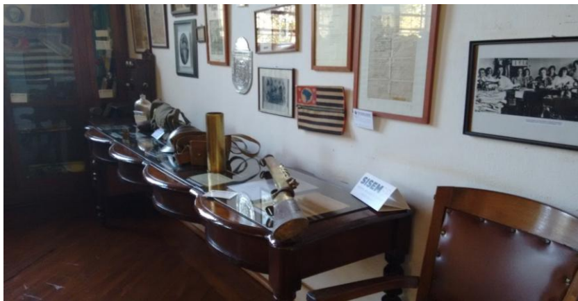
Peças utilizadas na Revolução de 1932