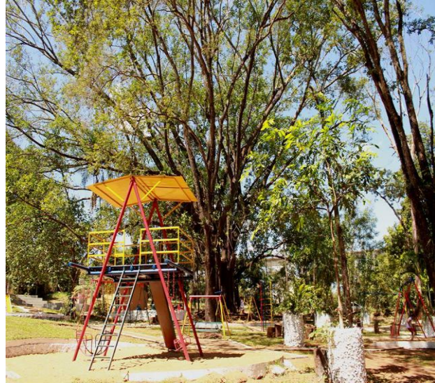
Brinquedo no Parquinho Sítio do Pica-Pau Amarelo