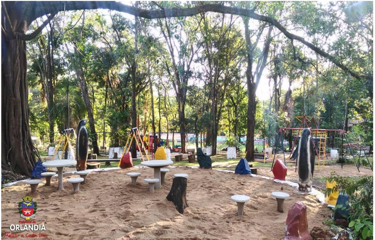
Parquinho Sítio do Pica-Pau Amarelo