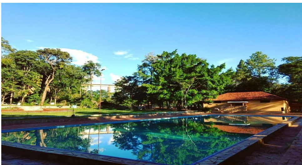
Piscina do Parque