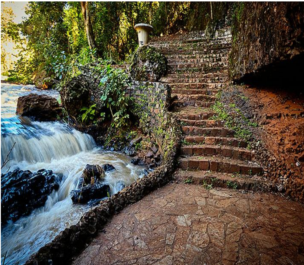
Escadaria de Pedras