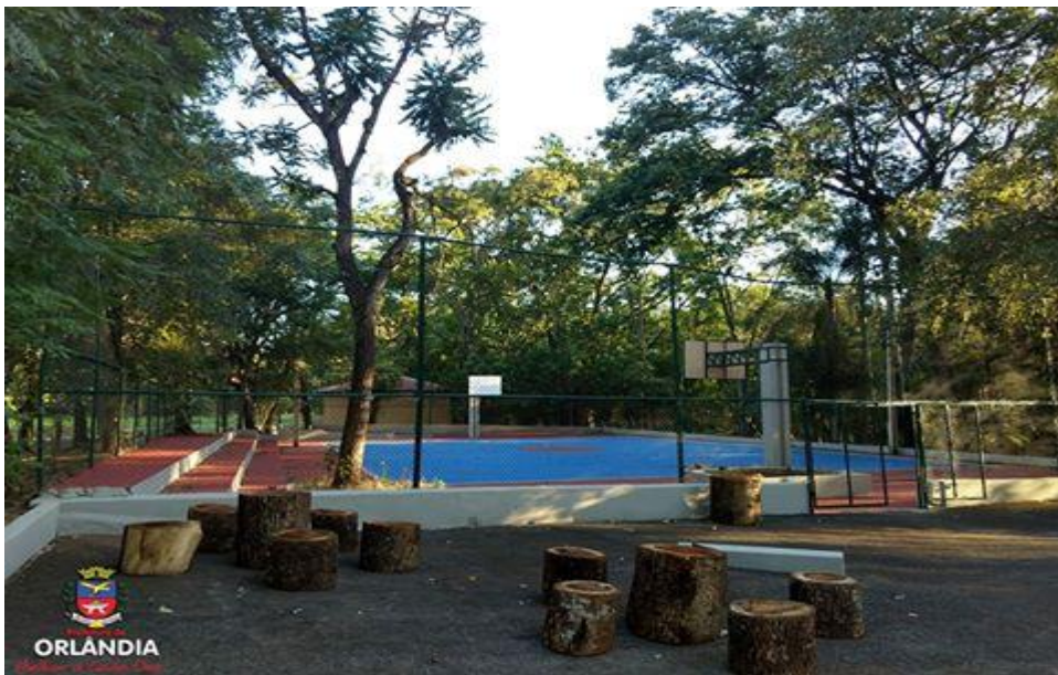
Quadra de Basquete