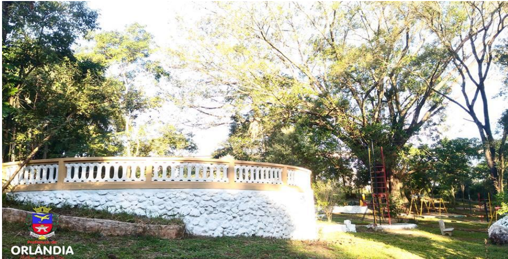
Mirante dentro do Parquinho Sítio do Pica-Pau Amarelo