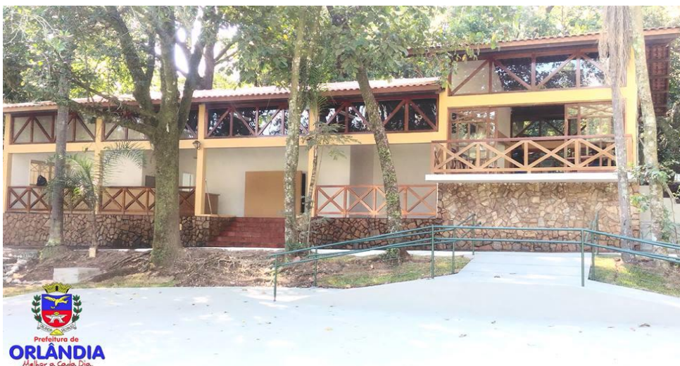
Restaurante do Parque