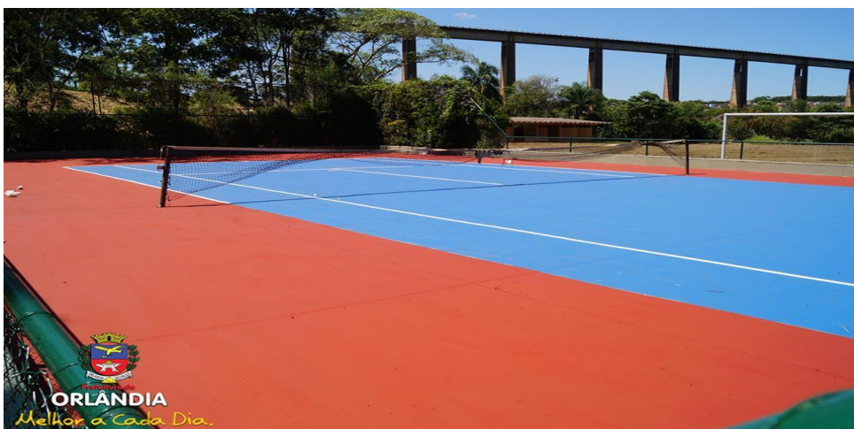
Quadra de Tênis