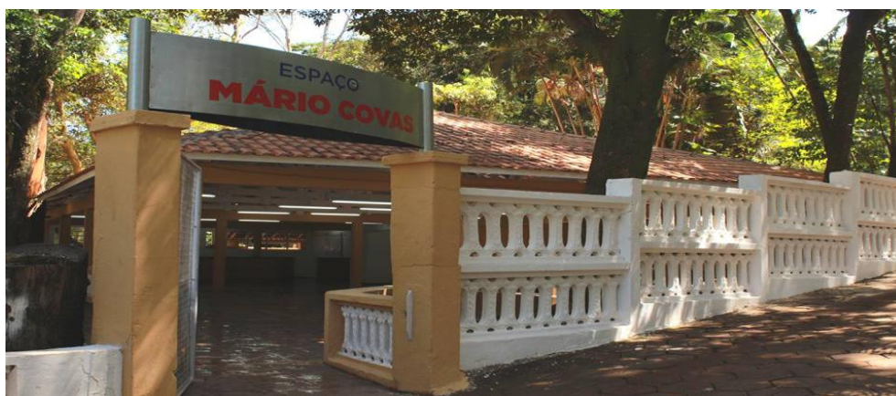
Espaço destinado a festas e eventos