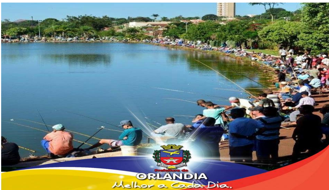
Tradicional Pescaria na Sexta Feira Santa

O Espelho D'água possui uma ampla pista para caminhada, com um parquinho infantil, Casa de Brinquedos denominada “Rodolfo Siqueira Massaro” que possui brinquedos para brincadeiras lúdicas que divertem e ensinam as crianças, possui também uma academia ao ar livre, que tem por objetivo melhorar o condicionamento físico, a qualidade de vida e a saúde das pessoas.