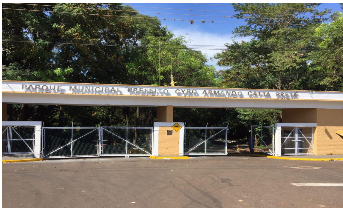
Entrada do Parque

Além de área de mata, o local tem cachoeira, trilhas para caminhadas, parquinho infantil denominado Sítio do Pica-Pau Amarelo, piscinas, quadras esportivas e quiosques para piquenique.