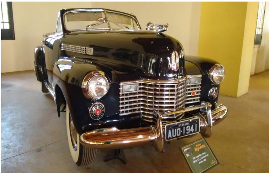
Modelo exposto no Museu de Carros Antigos - Agromen