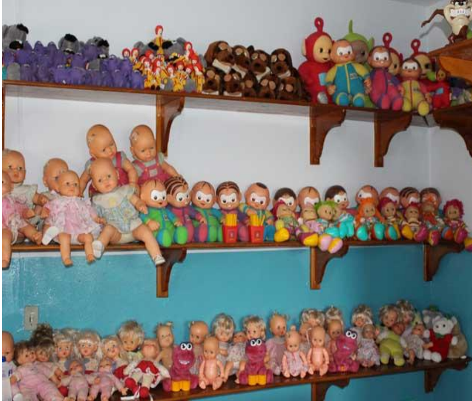
Casa de Brinquedos: Rodolfo Siqueira Massaro

sistema que se adapta ao usuário utilizando o peso do próprio corpo, criando resistência e gerando benefício personalizado, independente de idade, peso e sexo. São indicados para maiores de 12 anos e principalmente para pessoas da terceira idade, que perdem naturalmente um pouco da força muscular com o passar dos anos, mas podem ser usados por qualquer pessoa.