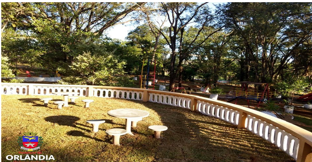
Mirante dentro do Parquinho Sítio do Pica-Pau Amarelo