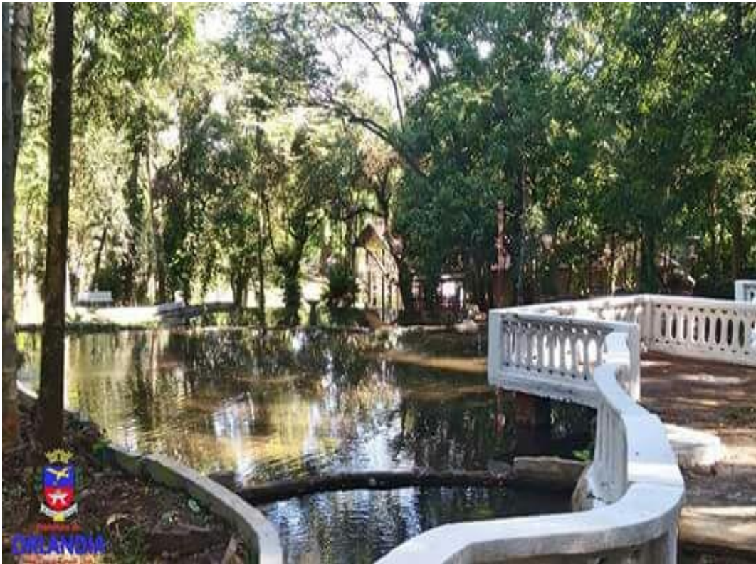
Lago com peixes