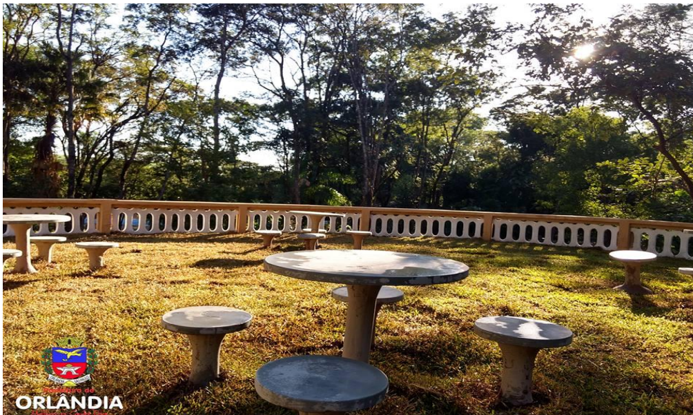
Mirante dentro do Parquinho Sítio do Pica-Pau Amarelo