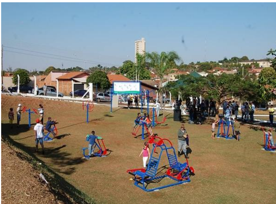
Academia ao Ar Livre