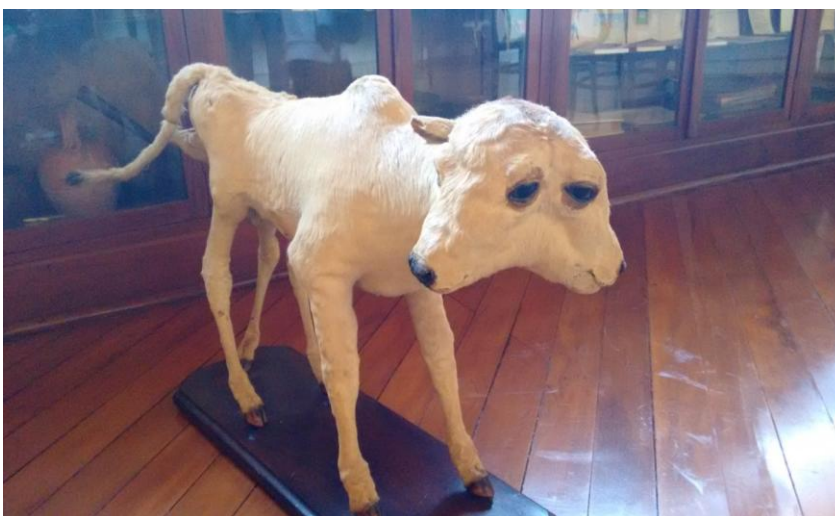
Bezerro com duas cabeças e cinco patas