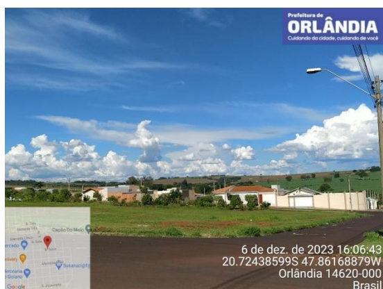
Figura 1 - vista do acesso a Quadra 98/43